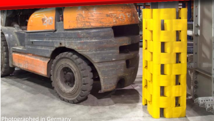
Photographed in Germany

Una columna estructural dañada puede ser peligrosa y muy costoso de reparar.